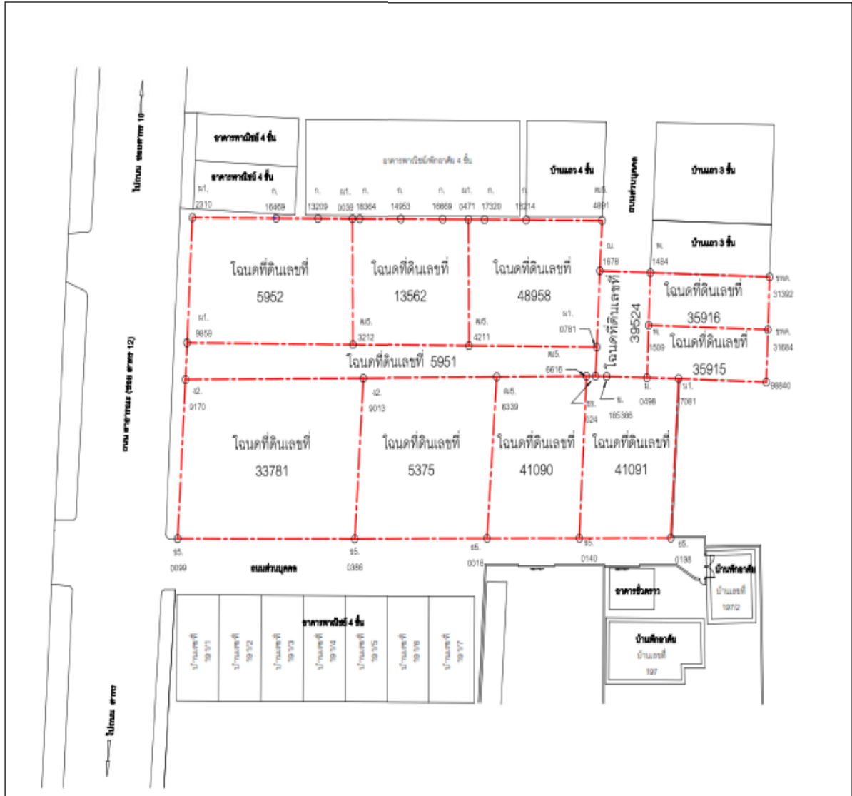
รูปที่ 1.2-1 แสดงผังต่อโฉนดที่ดิน